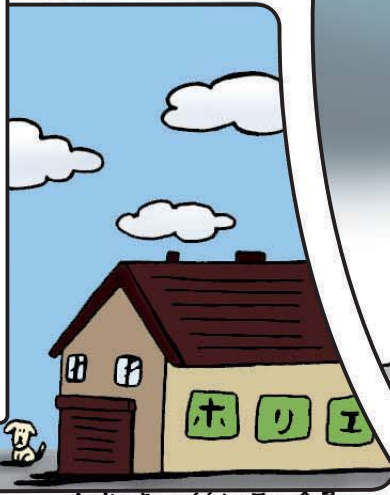
※当時は(有)土屋江金属でした。

悩んだ末に開発チームは金属加工で有名な新潟県燕市を訪れ、市の紹介で株ホリエに辿り着きました。